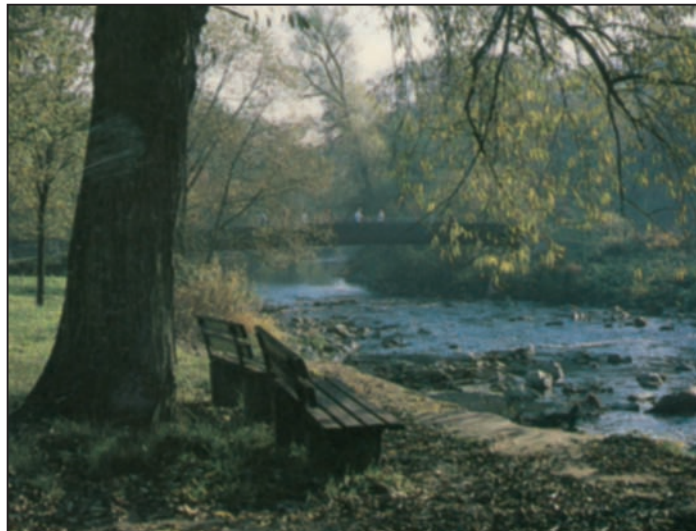
Die Ahr am Wehr, mit dem einst belebten Quellensteg im Hintergrund

Die Ahrue zwischen Sinzig und Bad Bodendorf im Bereich Schwanenteich, Kurgarten, Thermalbad könnte zu einem einzigartigen Naherholungsgebiet für die ganze Stadt ausgebaut werden. Hierzu ist die Erschließung des rechten Ahrufers durch einen neuen Steg an alter Stelle unerlässlich. Der Umweg über die 550 m entfernte verkehrsreiche Fr. v. Stein Brücke ist dafür keine Alternative. Die direkte Verbindung von der Kernstadt über den Schwanenteich zum Thermalbad über diese Brücke ist unverzichtbar. Sehr wichtig ist diese Ahrquerung auch für die Erstellung eines Konzepts für Bad Bodendorf als Start und Ziel für Wanderfreunde, denn sie bietet sich ideal für regionale und überregionale Wanderwege an. Aktuell gibt es eine Anfrage seitens der Initiatoren des neuen Rhein-Burgen-Wegs, den man über einen neuen Quellensteg führen will, da die Wegstrecke an der Ahr entlang hinüber zum Kurgarten vorbei an den Trinkstellen des St. Josef Sprudels, den Mühlenberg hinauf nach Sinzig wesentlich attraktiver und einem Prädikatswanderweg entsprechender ist. Allerdings klafft bei der Finanzierung des neuen Stegs immer noch eine größere Lücke, so dass weiterhin um Unterstützung gebeten wird.