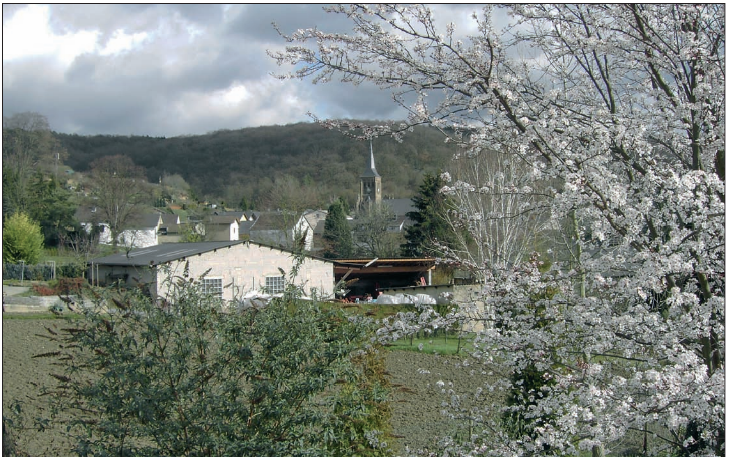
Auch der Frühling kann optimistisch stimmen