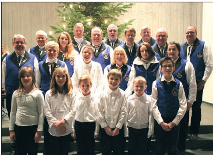
Der Spielmannszug „Blau-Weiß“ Bad Bodendorf mit seinen Musikschülern

Am 28. Dezember war es soweit: In der Pfarrkirche Sankt Sebastianus Bad Bodendorf spielte der Spielmannszug gemeinsam mit den Müdener Spielleuten unter der Leitung