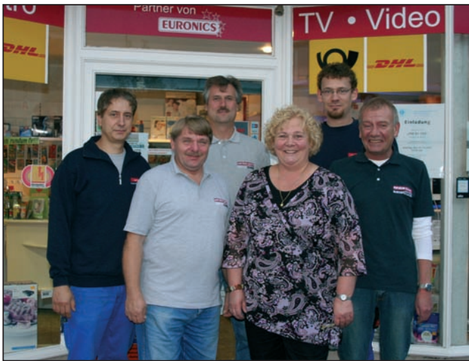
Das heutige Firmenteam