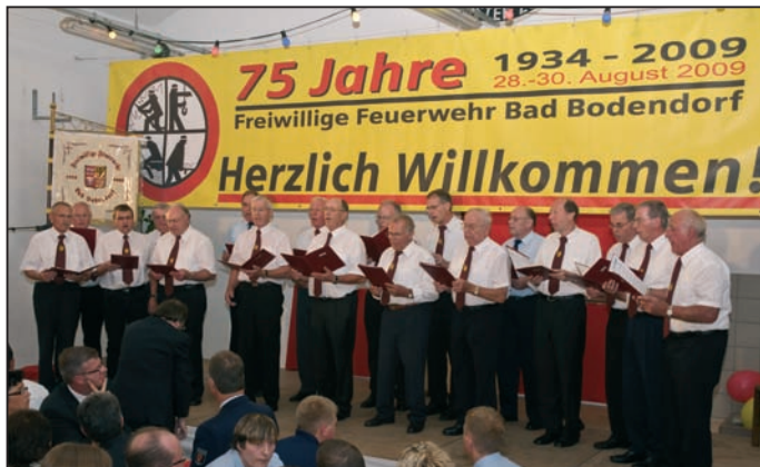
MGV „Eintracht“ beim Festakt.

Bei herrlichem Sommerwetter bevölkerte eine große Menschenmenge den historischen Ortskern vor dem Pfarrheim und lauschte den Klängen beider Musikgruppen, deren Repertoire von klassischen Werken und Marschmusik über Swing und Popsongs bis zu Evergreens von den Beatles reichte. Höhepunkte waren gemeinsam gespielte Stücke wie der Westfalenmarsch, der die Zuhörer begeisterte.