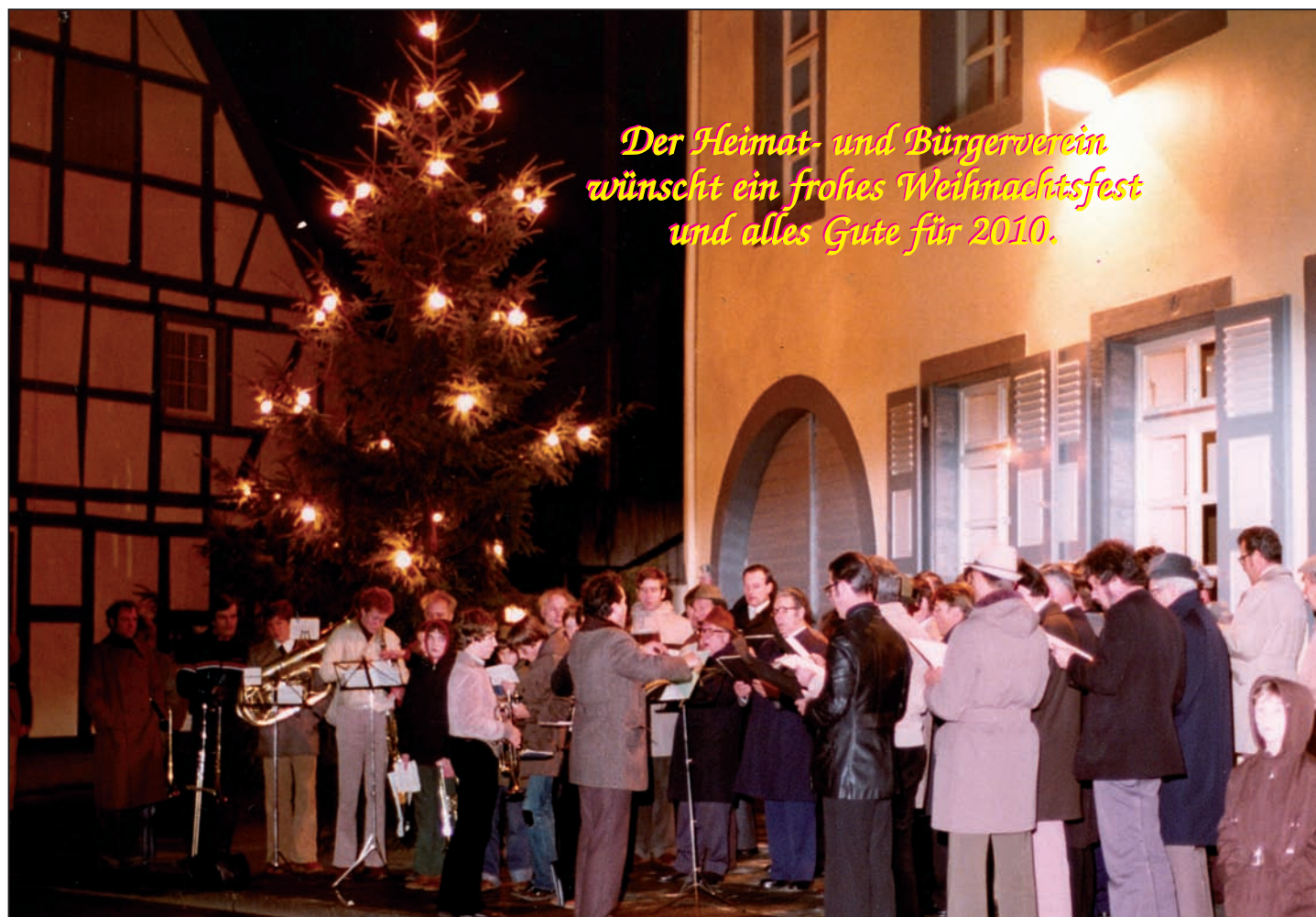
Friedvolles Weihnachtssingen vor dem Pfarrheim vor 30 Jahren (Bild 1979)